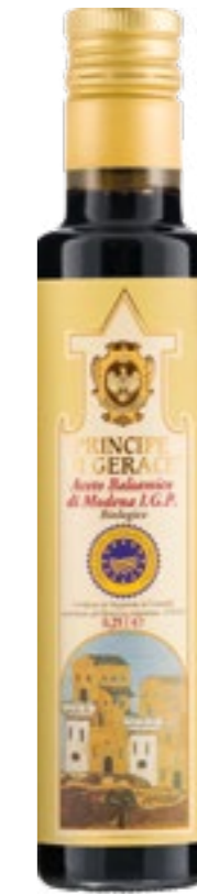
Aceto balsamico di Modena IGP Biologico

Prodotto in Emilia Romagna con gli antichi criteri di produzione e stagionatura in botte e secondo le linee guida del consorzio di tutela IGP, l' Aceto balsamico di Modena scelto per la linea "Principe di Gerace", rappresenta per noi il coronamento di una gamma di condimenti Mediterranei d'eccellenza. Invecchiato per almeno tre anni, con la sua viscosità agrodolce, il nostro balsamico è un tocco intenso per completare delicate ricette Gourmet o per insaporire contorni crudi o cotti.