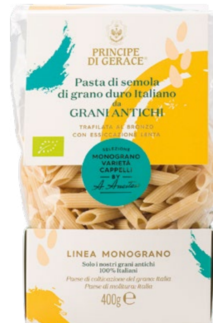
Penne di semola di grano duro Italiano Varietà Cappelli da agricoltura Biologica e Biodinamica

Ingredienti: Semola di grano duro Italiano biologica varietà Cappelli, acqua.