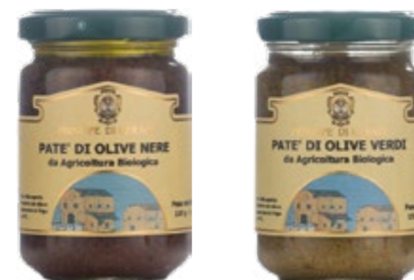
Paté di olive nere Paté di olive verdi da Agricoltura biologica

I nostri patè di olive, gli ingredienti che li compongono, preparati con sapienza e passione, sono il frutto di una tradizione antica la cui ricetta, si tramanda oramai da generazioni. Sofisticati e raffinati, i nostri patè, incontrano il gusto sia dei palati più esigenti che di chi ama i sapori semplici. Il gusto particolarmente delicato rende queste specialità versatili per diverse preparazioni gastronomiche: da appetitose tartine ed aperitivi, al condimento di primi piatti o pizze rustiche.