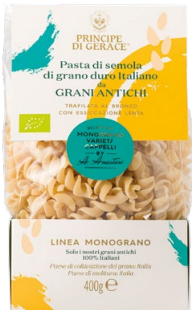
Fusilli di semola di grano duro Italiano Varietà Cappelli da agricoltura Biologica e Biodinamica

Ingredienti: Semola di grano duro Italiano biologica varietà Cappelli, acqua.