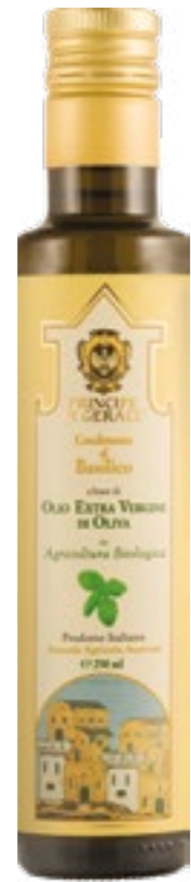
Condimento biologico a base di olio extra vergine di oliva infuso a freddo al Basilico

Il basilico coltivato nella nostra azienda agricola dove nel clima mite tra litorale ed entroterra cresce rigoglioso e profumato, appena essiccato è posto a macerare nel nostro olio extra vergine d'oliva. Da questa unione nasce un condimento leggero e gustoso, il nostro olio aromatizzato, ingrediente raffinato e versatile per la preparazione di speciali ricette.